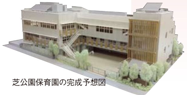
芝公園保育園の完成予想図