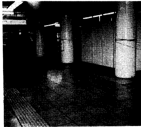
工事がはじまった御成門駅