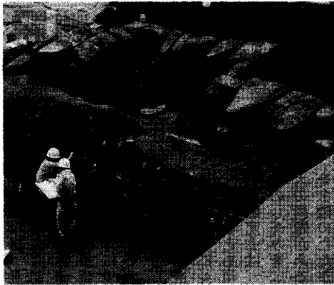
遺跡見学会。出土した石組みなど