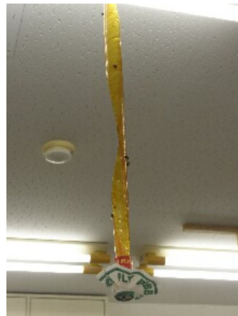
救援センターのハエ取りリボン

これから暑い夏を迎えます。心配されるのが、衛生面です。悪臭と共にハエや銀バエが繁殖しています。刻も早いヘド口除去が求められます。