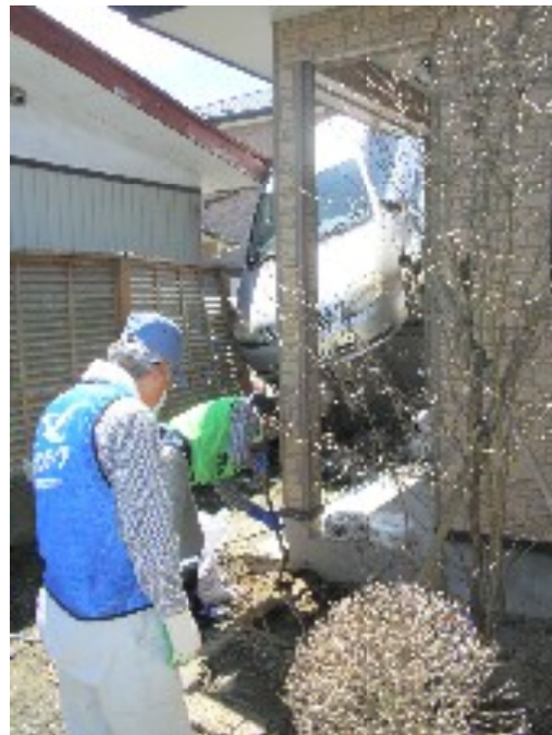
玄関のすぐ前に流された車が 突っ込んだまま