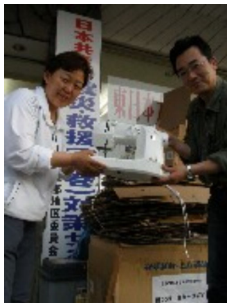
千葉県からセンターに届く

ない人も多い。自分はおばあちゃんたち二人を抱えてブロック塀の上によじのぼった。そこにも津波が来て、さらに鉄柵の上に逃げた、さらに樋をよじ登って、ばあちゃん二人をそこに押し上げて逃げた」