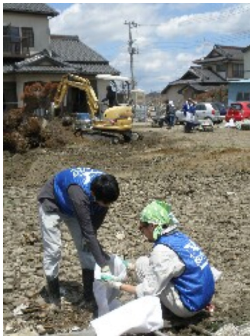
捨喰地域 自宅前の畑 ドロ出し