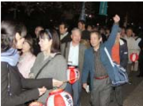
パレードに参加する風見区議

集会に飛び入りで参加する方や、沿道では、若い人たちが実行委員が配るピラを熱心に読み、質問までしている姿も見られました。