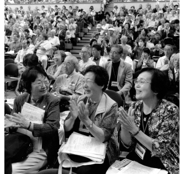
9月の全国高齢者大会

け離れたものであったことは選挙結果で明らか①認識への反省は?②制度廃止を国に求めよ③七五歳以上の医療費無料制度を国に求めよ。