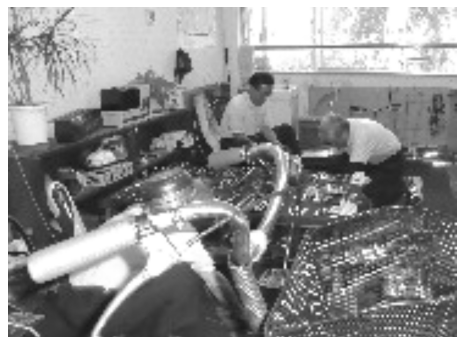
自転車のリサイクル事業

答弁 ①受注の確保に努める。②早急に移転先の確保に努め、事業の中断がないよう、最大限配慮する。