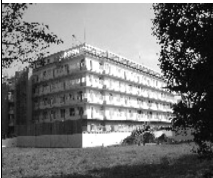
来年4月開設予定の南麻布施設

答弁 ①高齢者人口や要介護認定者数の推移、高齢者の住まい整備や在宅サービスの充実、介護予防を推進するなかで見定め、慎重に検討する②考えていない。