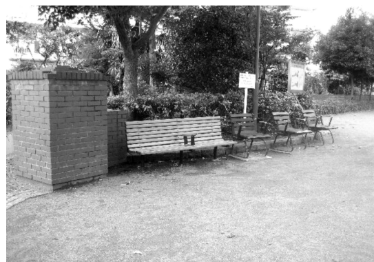
増設されたベンチ

よく利用する方から、「ベンチが増え、子ども連れの方も高齢者も安心して利用できるようになった」と喜びの声が寄せられています。