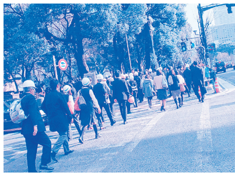
ビルから避難してきた人たち

高層マンションでは、エレベーターが止まりましたが、高層マンション防災対策は区民参加で抜本的に強化すべきです。