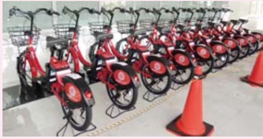
「みなとパーク芝浦」に自転車シェアリングサイクルポートが設置されました。