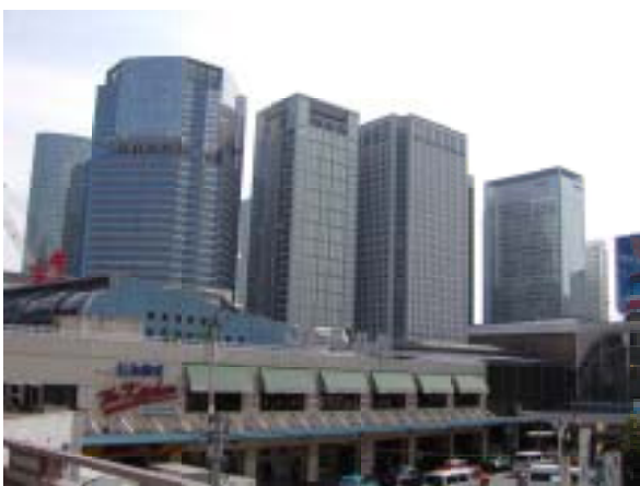
巨大なカベ、品川駅東口の超高層ビル群

【答弁】 中止を求めることは考えて いない。区の意見を反映するため、委 員として参加する。