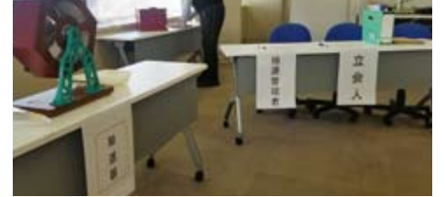
高齢者住宅の抽選会場

25戸を増やす。高齢者が住み慣れた 地域で自立した生活が出来るよう支援する」「都に迅速な募集を要請する」と答えました。